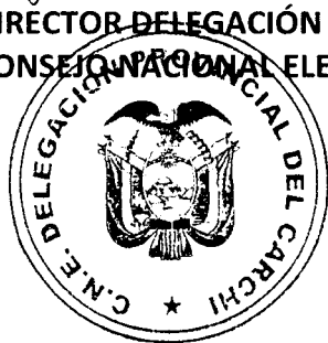
José Bastidas Rosero DIRECTOR DELEGACIÓN PROVINCIAL DEL CARCHI CONSEJO NACIONAL ELECTORAL ENCARGADO